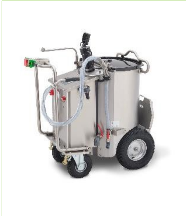
MilchMobil 120 Litres (pousser)