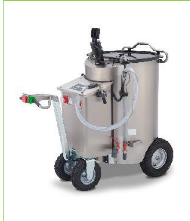
MilchMobil 200 Litres (tirer)